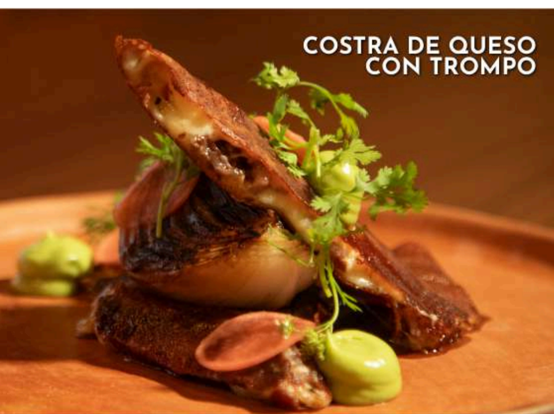
COSTRA DE QUESO CON TROMPO