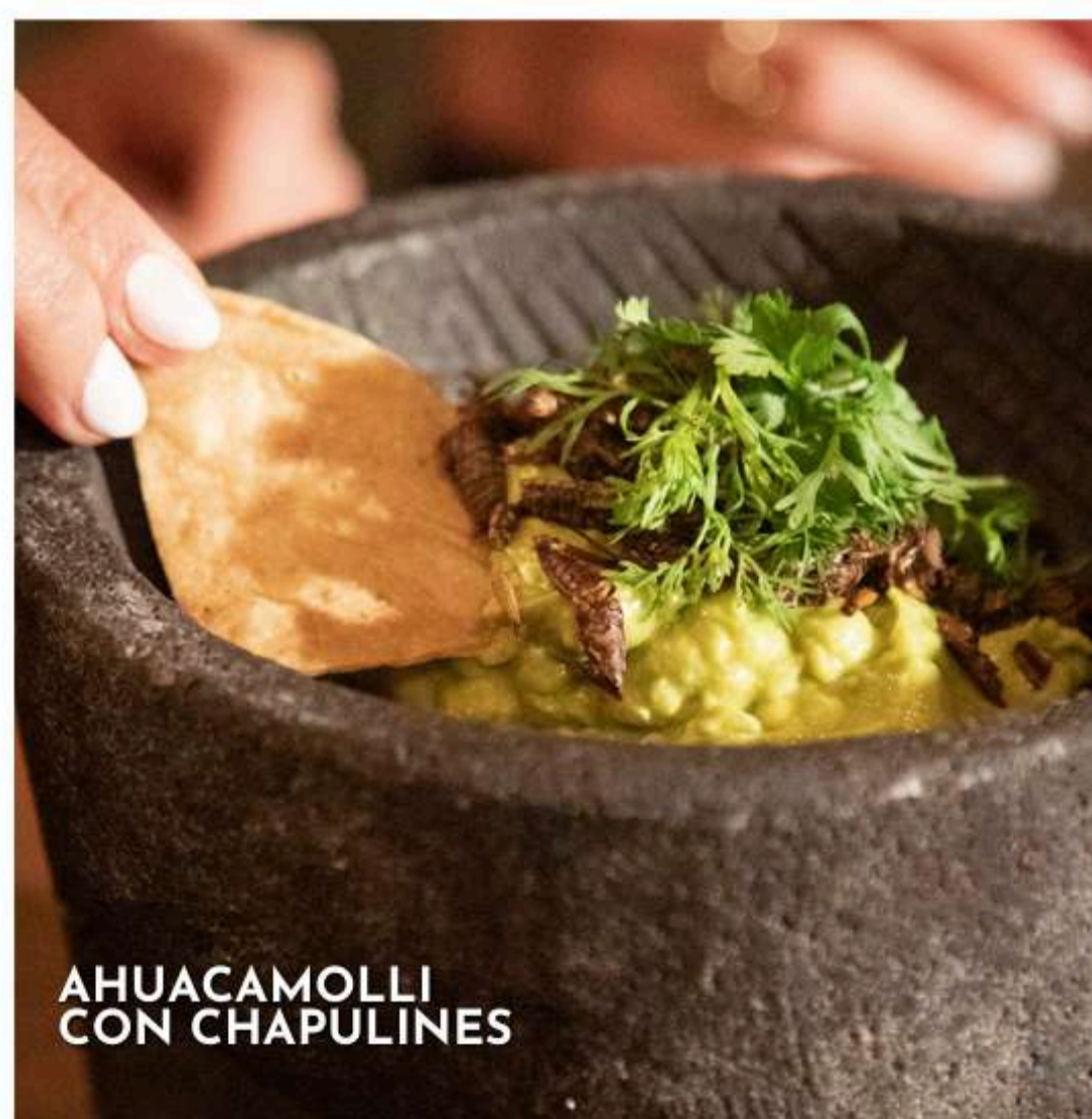
AHUACAMOLLI CON CHAPULINES