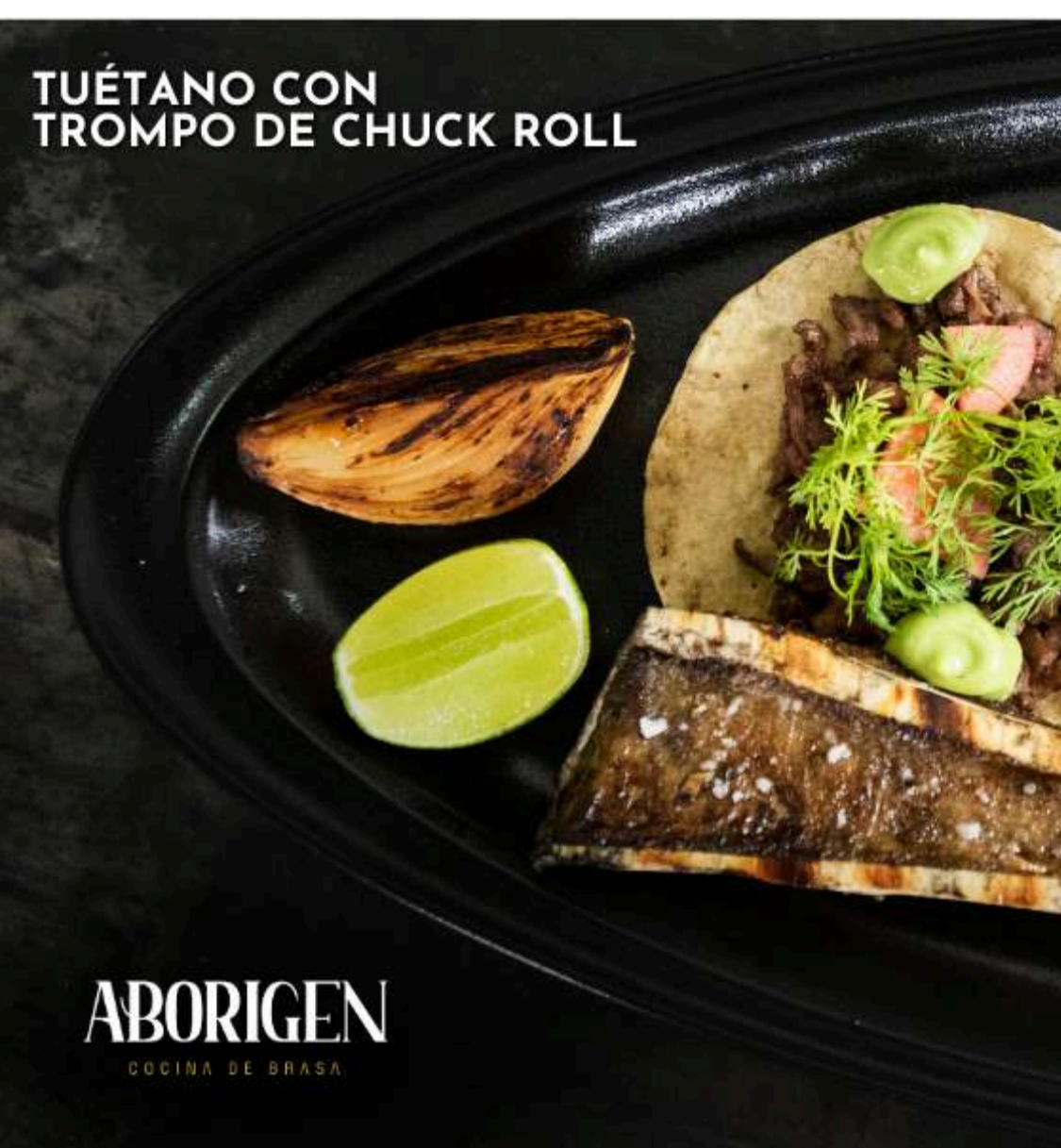
TUÉTANO CON TROMPO DE CHUCK ROLL